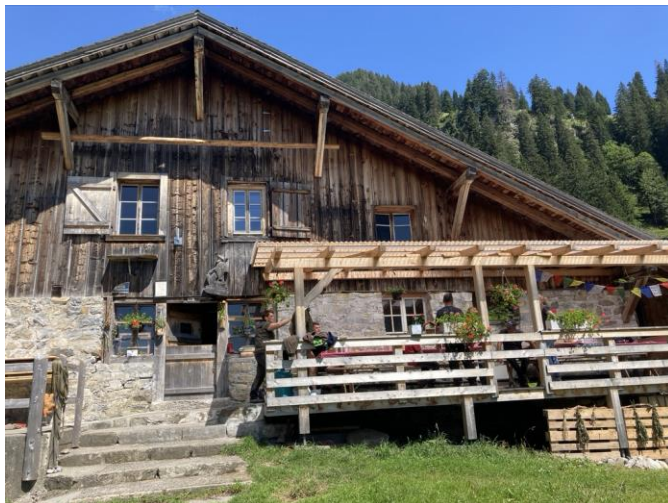
Alp Hindersberg, Justistal