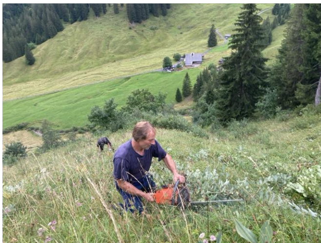
Sämu am schwenten

Sämus Tochter empfängt uns, nun wieder bei Sonnenschein, auf der Terrasse der Alphütte mit Nudeln, Hackfleisch und Apfelmus - eine herrliche und willkommene Stärkung! Als kleines Dankeschön für die getane Arbeit darf jeder Helfer ein Stück Alpkäse mit nach Hause nehmen.